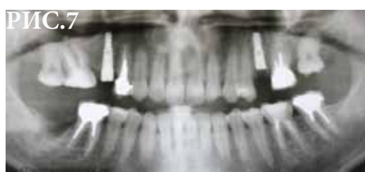
Рис. 7 послеоперационный Rg.